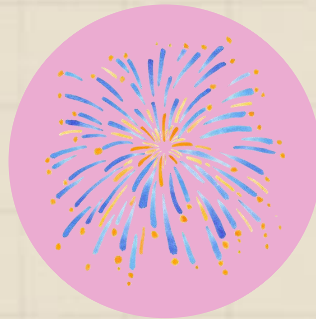
วันขึ้นปีใหม่