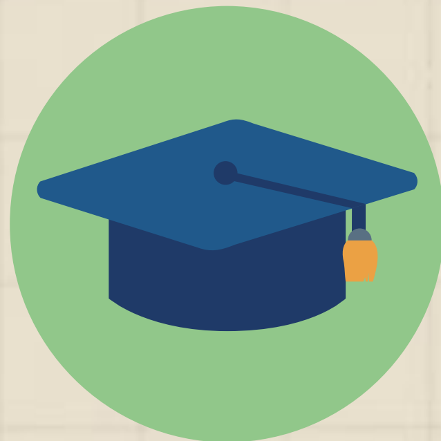
วันสำเร็จการศึกษา