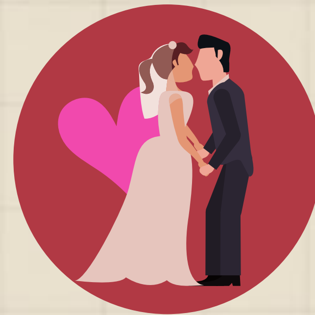
วันแต่งงาน